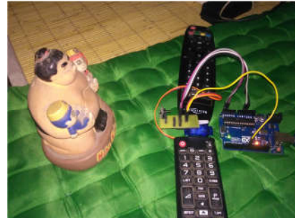
Gambar 3 Pengujian Lidar mengukur jarak objek

Dari hasil percobaan yang dilakukan gambar diatas terhadap jarak antara lidar dan objek sebagai berikut