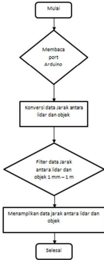
Gambar 2 Flowchart Sistem