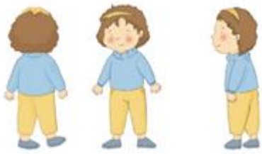
Gambar 2. Karakter utama Nina ilustrasi oleh Dwi, 2019

Dalam perancangan karakter dan setting , ilustrasi dibuat menyerupai kartun agar anak-anak lebih tertarik dan tidak bosan untuk melihatnya. Penggunaan baju sweater dan bando pada karakter tokoh utama agar terkesan lembut dan ceria tetapi juga ada ciri khas tersendiri. Setting tempat kebanyakan berada di halaman rumah.