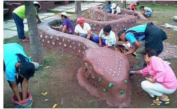
Gambar 1. Membangun Ecobrick ilustrasi oleh www.idntimes.com

yaitu bisa berupa video atau buku cerita yang disertai dengan diskusi.