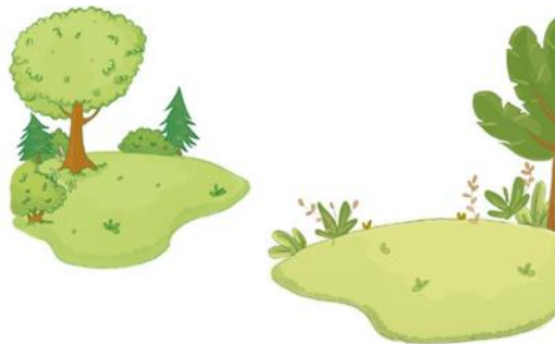
Gambar 3. Setting halaman ilustrasi oleh Dwi, 2019