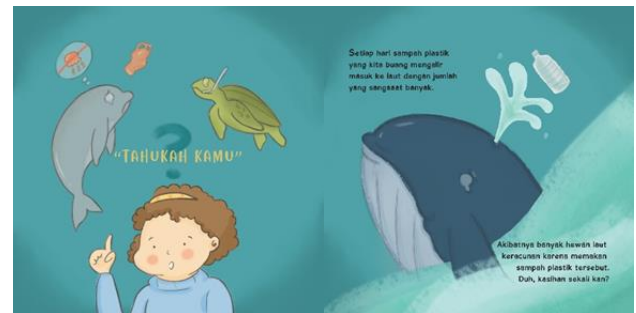
Gambar 5. Halaman 2 dan 3 ilustrasi oleh Dwi, 2019

Cerita dimulai dari fakta dan informasi tentang sampah plastik dan pengaruh buruknya terhadap kehidupan hewan laut dengan ilustrasi yang ditampilkan adalah nina yang sedang menjelaskan dan hewan laut seperti lumba-lumba, penyus, dan paus.