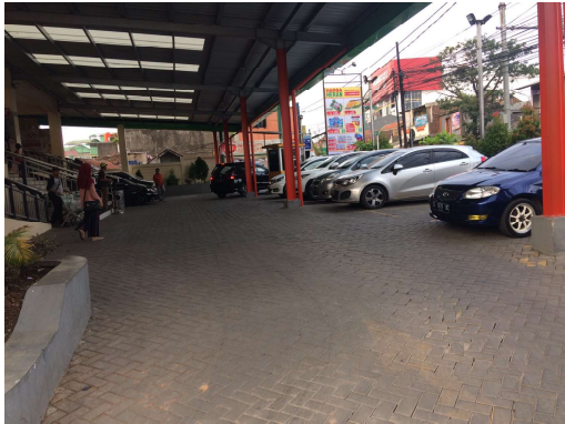
Gambar 1. Ilustrasi Tempat Parkir Pada Pusat Perbelanjaan

pusat perbelanjaan tersebut. Mengetahui prediksi kapasitas tempat parkir juga memberikan manfaat bagi pelanggan dan pengelola pusat perbelanjaan. Pelanggan dapat menghindari waktu ketika pusat perbelanjaan sedang padat pengunjung dan memilih belanja di waktu ketika keadaan di pusat perbelanjaan sedang sepi sehingga memberikan kenyamanan bagi pelanggan saat berbelanja. Sedangkan pengelola dapat mengetahui waktu dimana terlihat penurunan jumlah pengunjung sehingga dapat dilakukan kegiatan di waktu tersebut untuk menarik perhatian pengunjung. Berikut ini merupakan ilustrasi tempat parkir di pusat perbelanjaan