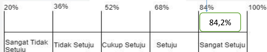
Gambar 2 Garis Kontinum Variabel Budaya Organisasi

Dari hasil analisis deskriptif kepada 112 responden, variable budaya organisasi mendapat skor 83,3% yang masuk dalam kategori baik.