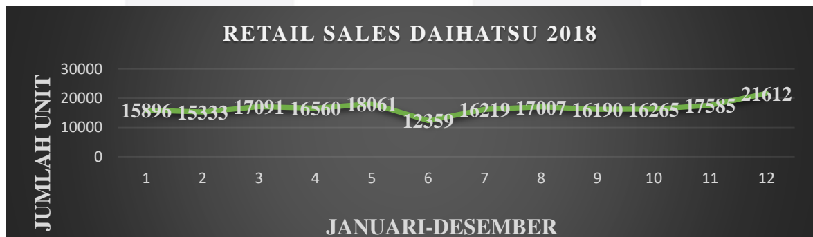
GAMBAR 1. Retail Sales Daihatsu 2018

Pencapaian Daihatsu pada tahun 2016 bisa dikatakan wonderful. Target yang di tetapkan pada awal tahun hanya mempertahankan pangsa pasar sama dengan tahun sebelumnya, yaitu 15%. Daihatsu Sigra pun baru keluar di semester kedua. Artinya, konsistensi PT. Astra International Daihatsu dalam memasarkan mobil-mobilnya telah menunjukkan keandalan produk Daihatsu (sumber Gaikindo.or.id)