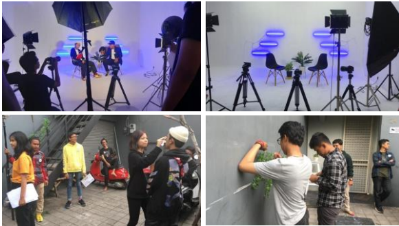
gambar 1.3 Proses Produksi Film Bobbeast

Sehingga latar tempat yang perlihatkan dalam film sesuai dan memiliki kedekatan dengan lingkungan ataupun aspek-aspek yang terdapat dalam gaya hidup Hypebeast.