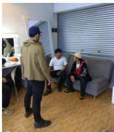
gambar 1.4 Proses Produksi Film Bobbeast

Latar waktu pada film ini terjadi pada tahun 2019, latar waktu ditekankan pada beberapa adegan yang terdapat didalam film. Misalnya terlihat dari pakaian dan aksesoris yang digunakan oleh tokoh utama yaitu jaket Off-White Multicolor Arrows yang dirilis pada tahun 2019 serta waist bag supreme yang dirilis pada waktu yang bersamaan. Pemilihan latar waktu pada tahun 2019 agar dapat relatable dengan trend yang sedang terjadi pada saat ini.