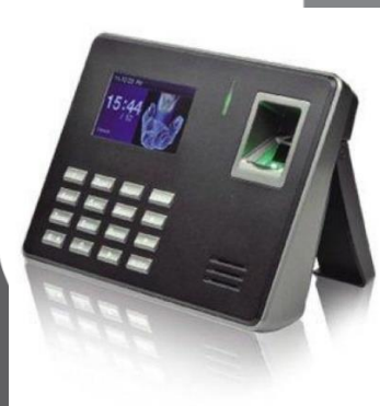
Gambar. 1.1 perangkat alat sidik jari

Perangkat fingerprint ini relatif kurang efisien, dikarenakan memerlukan instalasi, serta tidak dapat digunakan secara portable. Dengan dibuatnya sistem ini maka diharapkan setiap orang dapat melakukan sidik jari dimanapun dengan bantuan smartphone yang dimiliki.