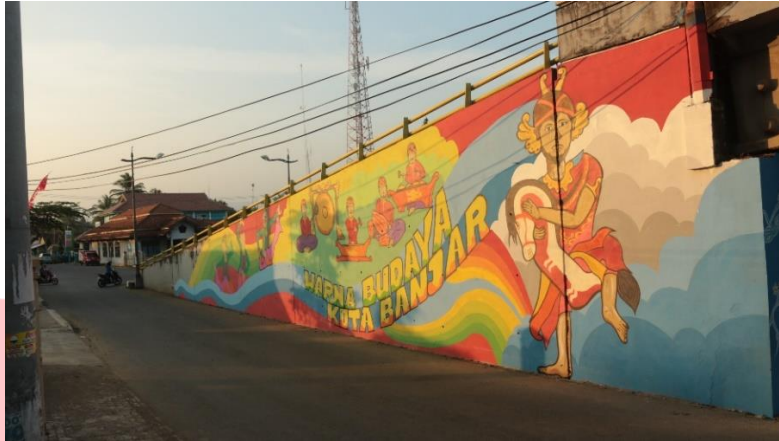
Gambar 7 Hasil Perancangan