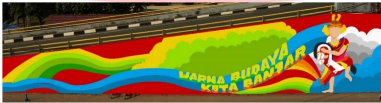
Gambar 2 Konsep Digital Digital