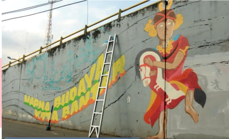
Gambar 4 Proses Perancangan