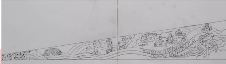
Gambar 1 Sketsa