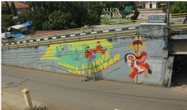
Gambar 5 Proses Perancangan