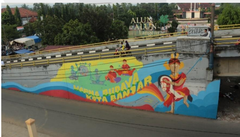
Gambar 6 Proses Perancangan