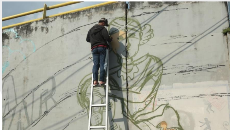
Gambar 3 Proses Perancangan