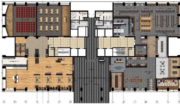
Gambar 2 Layout Lantai 1