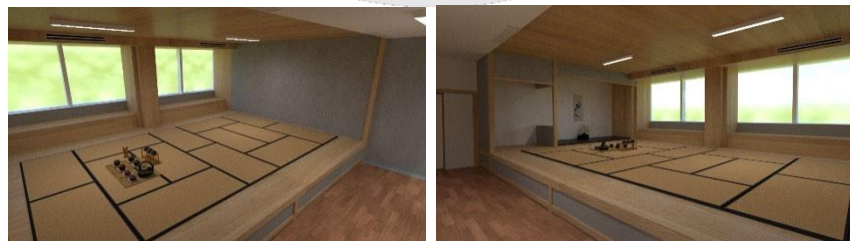
Gambar 5 Ruang Kelas Budaya

Ruang Kelas Kebudayaan memiliki konsep tea house dengan menciptakan suasana seperti berada di ruang tradisional Jepang.