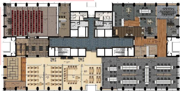
Gambar 1 Layout Lantai 2