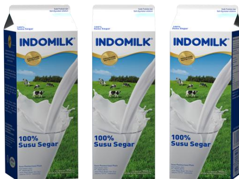
Gambar 1. 2 Pasteurized Milk Liquid

Susu segar Indomilk atau biasa dikenal sebagai Susu Pasteurisasi Indomilk mengandung berbagai vitamin, seperti vitamin A, B1, B6, D3 dan E. susu segar Indomilk memiliki pilihan rasa seperti susu full cream rasa coklat dan tawar serta susu non fat rasa tawar yang diperkaya inulin. Untuk susu segar rasa coklat menggunakan bubuk coklat asli dan rendah gula. Seperti namanya, susu ini adalah susu segar, sehingga usia produk hanya 21 hari dan maksimal penyimpanan pada suhu 40 derajat celcius.