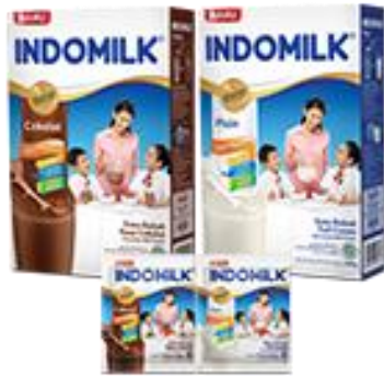
Gambar 1. 6 Susu Bubuk Indomilk