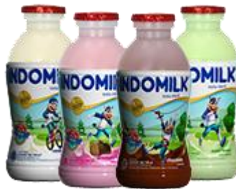
Gambar 1. 5 Susu Cair Indomilk

Susu cair steril Indomilk adalah produk susu cair yang diperoleh dari susu segar yang dipanaskan pada suhu tidak kurang dari 100 derajat selama waktu yang cukup untuk mencapai keadaan steril lalu dikemas dalam botol plastik transparan yang kedap udara sehingga dapat bertahan lama tanpa bahan pengawet. Pilihan rasa yang disajikan berupa coklat, strawberry , melon, dan vanilla