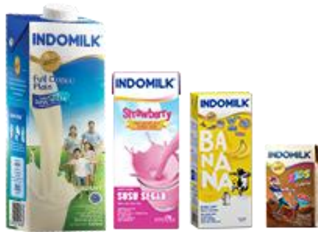
Gambar 1. 3 UHT Indomilk

Susu Indomilk UHT adalah susu dalam kemasan kotak siap minum yang diolah dengan proses sterilisasi HTST ( High Temperature Short Time , dipanaskan pada suhu 140-145 Celcius selama 4 detik yang akan membunuh bakteri jahat). Proses ini membuat susu bisa disimpan hingga 9 bulan. Pilihan rasa yang disajikan adalah cokelat, strawberry, vanilla, pisang, mangga, dan melon.