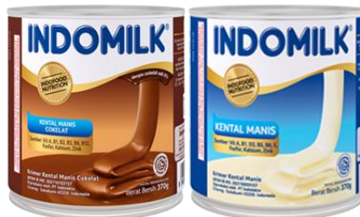
Gambar 1. 4 Susu Kental Manis Indomilk

Kental Manis Indomilk adalah produk susu berbentuk cairan kental yang diperoleh dari susu segar diolah dengan sistem pengolahan yang modern, yang ditambahkan gula, lemak nabati dan bahan pangan lainnya. Varian rasa yang disajikan ialah cokelat dan plain (vanilla). Susu kental manis biasanya dijadikan sebagai bahan tambahan dalam pembuatan makanan penutup.