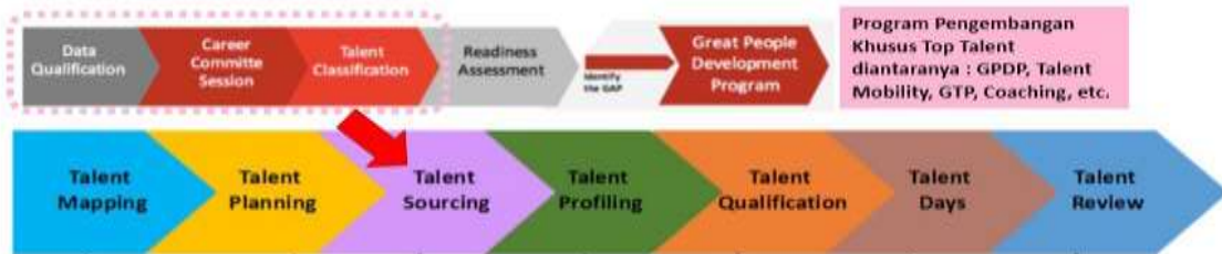
Gambar 1.1 Program Manajemen Talenta Yayasan Pendidikan Telkom

Sekelompok orang berbakat tersebut disebut dengan talent pool . [12] menjelaskan bahwa adanya talent pool diciptakan sebagai sebuah tempat dalam melakukan pengembangan sumber daya manusia di dalam perusahaan untuk mempertahankan bakat terbaik. Adanya talent pool dalam sebuah perusahaan membantu untuk mengidentifikasi kapasitas yang dimiliki oleh karyawan untuk dapat terus dikembangkan dan kemudian memiliki potensi secara umum untuk memimpin sebuah perusahaan.