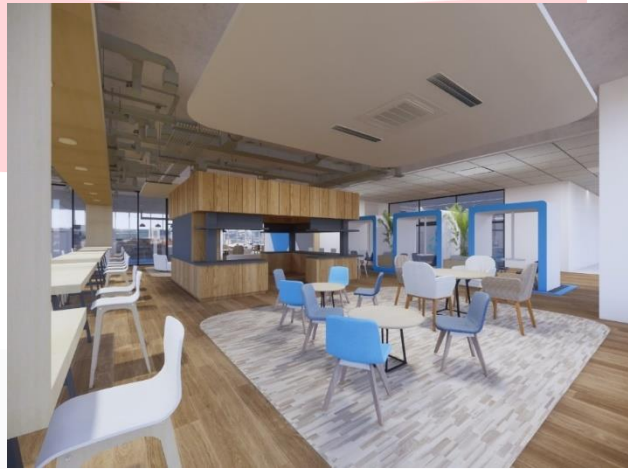
Gambar 4.23 Perspektif Suasana Break Area

Suasana pada area ini tetap menggunakan pengayaan modern kontemporer dengan sentuhan kombinasi dari industrial dan minimalis. Fasilitas yang disediakan pada area ini adalah fasilitas – fasilitas yang berguna untuk berdiskusi dan bersantai.