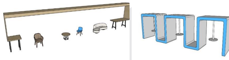
Gambar 4.26 Furniture Break Area

Bentuk furniture yang geometris diadaptasi dari bentuk jendela dan dikombinasikan dengan desain yang masa kini agar menjadi sebuah desain modern kontemporer.