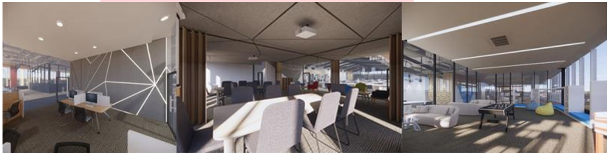
Gambar 4. 2 Aplikasi Soundstop Karpet dan Kaca

Pemilihan material yang dapat menonjolkan unsur kontemporer dengan mengandalkan material natural seperti kayu, beton, besi, dan kaca.