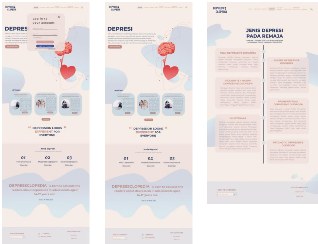
Gambar 2 Media Utama

Berikut ini merupakan beberapa tampilan User Interface dari website Depressclopedia.