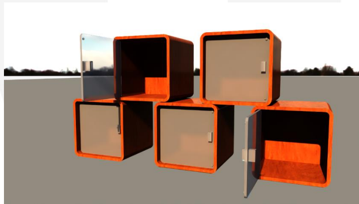
(Desain Final)