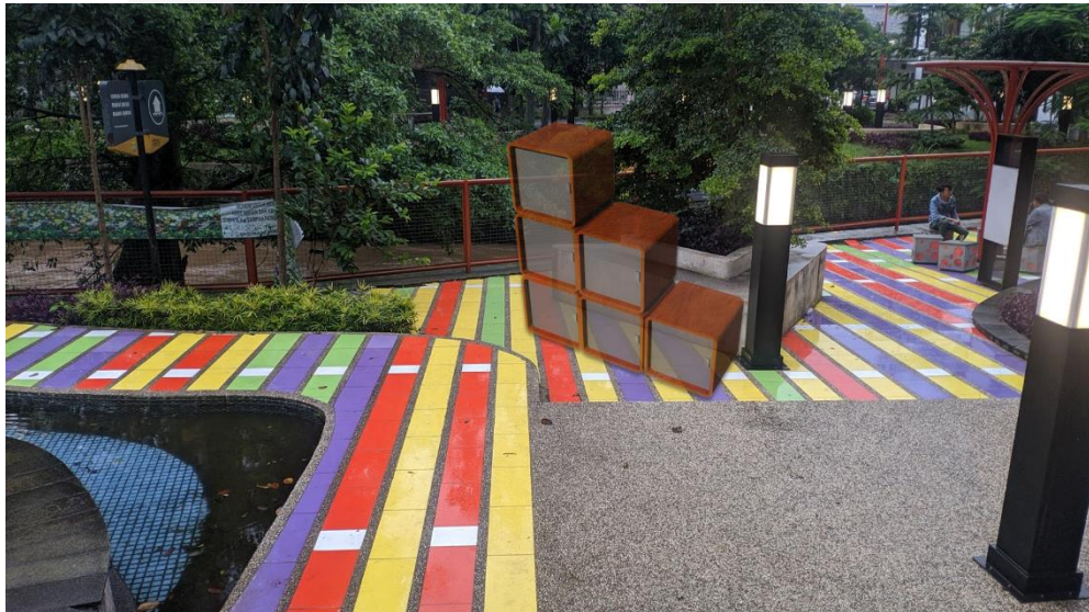
(Desain Final)

Setelah ditentukannya desain, dipilih dan dibuat ke dalam bentuk 3D untuk mendapatkan sebuah gambaran yang akan terlihat pada hasil akhir.