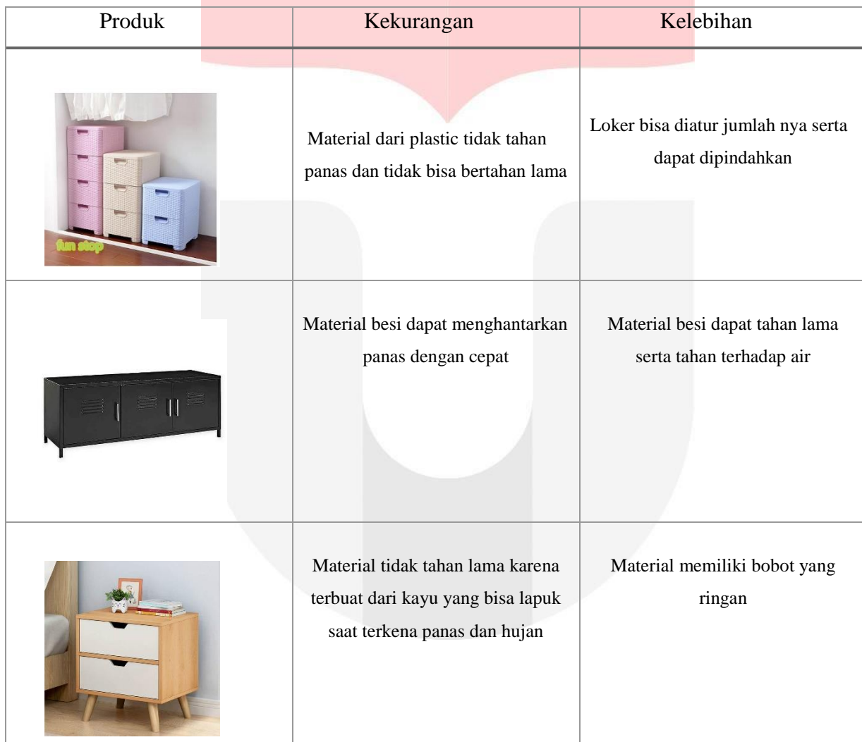
Tabel 4.1 (Komparasi Material)