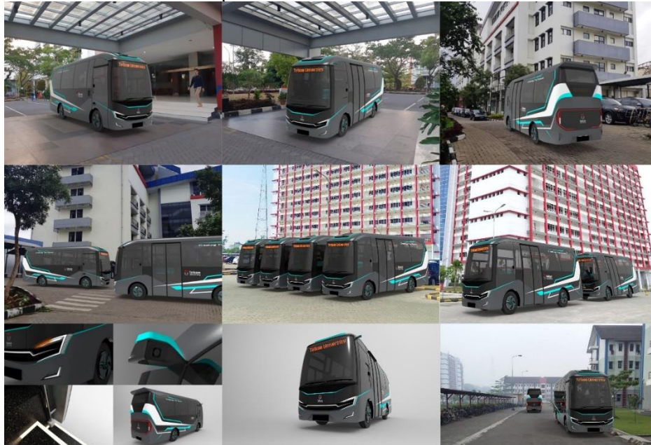
Gambar 5. Visualisasi Karya Eksterior Kendaraan Mikro Bus Dalam Kampus Universitas Telkom

Tahap visualisasi karya merupakan tahap mewujudkan desain yang telah dirancang, namun hanya menggunakan bantuan aplikasi tiga dimensi pada komputer//laptop. Berikut ini merupakan hasil perancangan eksterior kendaraan mikro bus dalam kampus Universitas Telkom