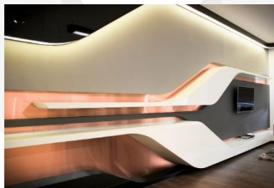
Gambar 1. Bentuk Geometris Futuristik

Pada gaya desain futuristik, bentuk geometris dapat ditemukan pada garis lurus yang membentuk suatu sudut. Sudut tersebut dapat digantikan oleh garis lengkung. Bentuk geometris mudah diproduksi karena terdiri dari garis-garis yang mudah dihitung. Bentuk pada gaya desain futuristik memiliki ciri-ciri garis yang memanjang serta melengkung sehingga bersifat aerodinamis dengan desain yang ringkas dan mengalir (Dekoruma.com, 2018).