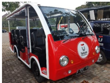
Gambar 2. Bus Dalam Kampus Universitas Telkom

Usaha Universitas Telkom dalam menciptakan kampus yang peduli terhadap lingkungan yakni membuat kebijakan dengan mengoperasikan mobil wara-wiri. Mobil wara-wiri atau yang biasa disebut Tayo, merupakan kendaraan yang digunakan untuk membantu mahasiswa, dosen dan staf Universitas Telkom berpindah dari satu tempat ke tempat lainnya. Kebijakan ini bertujuan untuk mengurangi jumlah kendaraan bermotor yang melintas di dalam kampus Universitas Telkom.