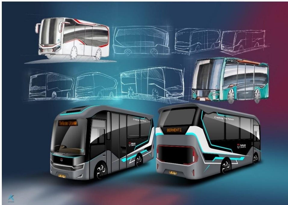
Gambar 4. Sketsa Eksterior Kendaraan Mikro Bus Dalam Kampus Universitas Telkom

Setelah menentukan blocking product tahap selanjutnya adalah sketsa. Sketsa dilakukan dengan pensil, hingga bantuan aplikasi digital pada komputer/laptop. Dari beberapa sketsa dipilih satu sketsa dengan penilaian terbaik.