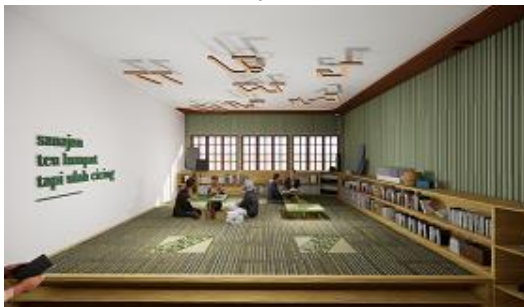
(Gambar 1. Perspektif Ruang Pengajaran)

Dalam perancangan Re-Desain Pusat Pengembangan Kebudayaan Sunda, area yang dipilih sebagai denah khusus merupakan ruang-ruang yang mendukung aktivitas sehari-hari yang juga mendukung kegiatan pengembangannya. Serta menggambarkan ruang kolaborasi di dalamnya yang identik dengan ngariung. Berikut beberapa plot ruang yang digunakan dalam denah khusus, yaitu: