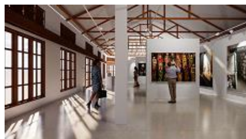
(Gambar 6. Perspektif Ruang Pameran)

Ruang kelima adalah ruang lukis, tata layout dibuat saling berhadapan dimana pada bagian tengah merupakan area melukis guru dan di bagian tengah ruang digunakan untuk guru mengontrol murid yang diajarinya. Ruang lukis ini dapat menampung 15 orang untuk melukis menggunakan kanvas, selain itu ruang lukis ini juga dilengkapi dengan rak untuk menyimpan perlengkapan mewarnai untuk melukis.