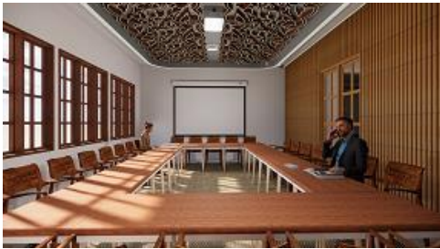
(Gambar 7. Perspektif Ruang Serba Guna)

Ruang ketujuh adalah ruang serba guna, penyusunan meja dan kursi di ruang serba guna ini dapat disusun sesuai dengan keinginan agar dapat menyesuaikan kegiatan yang digunakan. Desain ruang ini dibuat lebih minimalis karena pada bagian ceilingnya sudah terlalu detail ukiran batik sukapura yang digunakan sebagai pencahayaan. Pemilihan batik sukapura karena batik ini merupakan identitas bangsa Indonesia yang menggambarkan masyarakat Sunda. Batik ini memiliki konsep geometric dan sejumlah keteraturan dengan motif alam yang membawa cerita ke masa lalu dan memiliki pesan moral yang apabila diterapkan dalam kehidupan setiap generasi akan membawa kemajuan, itulah juga yang diharapkan untuk gedung ini agar terus maju dari generasi ke generasi.