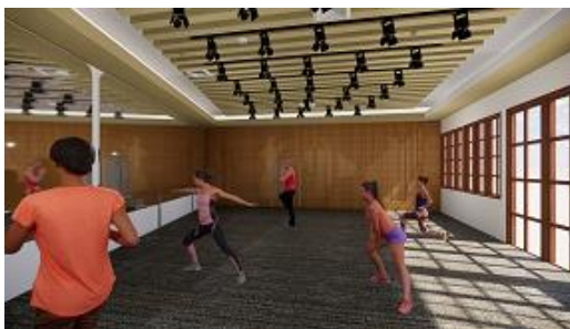
(Gambar 8. Perspektif Ruang Sanggar Tari)

Ruang ketujuh adalah ruang serba guna, penyusunan meja dan kursi di ruang serba guna ini dapat disusun sesuai dengan keinginan agar dapat menyesuaikan kegiatan yang digunakan. Desain ruang ini dibuat lebih minimalis karena pada bagian ceilingnya sudah terlalu detail ukiran batik sukapura yang digunakan sebagai pencahayaan. Pemilihan batik sukapura karena batik ini merupakan identitas bangsa Indonesia yang menggambarkan masyarakat Sunda. Batik ini memiliki konsep geometric dan sejumlah keteraturan dengan motif alam yang membawa cerita ke masa lalu dan memiliki pesan moral yang apabila diterapkan dalam kehidupan setiap generasi akan membawa kemajuan, itulah juga yang diharapkan untuk gedung ini agar terus maju dari generasi ke generasi.