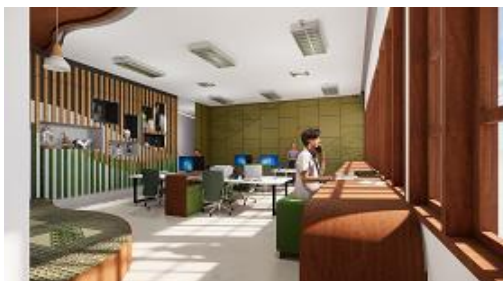
(Gambar 4. Perspektif Ruang Kantor)

teater. Untuk area lesehan bagian ceilingnya di desain dengan anyaman bambu yang memiliki cela sekitar 1-2cm yang dibuat seperti atap rumah dan apabila disinari dengan lampu dari atasnya akan terdapat bayangan seperti rumah tradisional yang masih menggunakan material bambu.