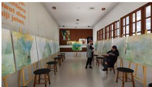
(Gambar 5. Perspektif Ruang Lukis)

Ruang keempat adalah kantor, terdiri dari ruang meeting khusus karyawan, ruang pimpinan, ruang kerja karyawan dan pantry. Untuk area kerja karyawan terdapat tiga area. Area pertama adalah set kursi dan meja yang saling berhadapan dengan rekan kerja lainnya dibuat berhadapan agar bisa mudah untuk berkomunikasi. Selain itu juga terdapat area lesehan apabila karyawan jenuh dan lelah duduk di kursi. Selain itu juga ada area bar pada sisi jendela untuk mengisi ruang kosong. Selain itu pada sisi kiri ruang kerja terdapat dinding yang di khususkan untuk menyimpan piagam dan penghargaan bagi gedung ini.