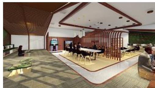
(Gambar 3. Perspektif Ruang Kafetaria)

Ruang kedua adalah Ruang Gamelan, di desain dengan tata layout yang saling berhadapan yang diperuntukan agar sirkulasi jalan yang baik, karena luasan ruang yang minim tetapi memiliki banyak alat musik di dalamnya. Peletakkan alat musik dibagi menjadi dua bagian yaitu pada sisi kiri dan kanan ruang untuk memaksimalkan sirkulasi sehingga pada bagian tengah ruang dapat digunakan oleh pengajar untuk melihat satu per satu pemain musik.