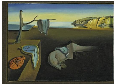
Gambar 1.1 Karya Salvador Dali "The Persistence of Memory" (1931) sebagai contoh penggambaran dunia mimesis

miripnya. Dalam pandangan plato dunia mimesis berkaitan dengan perkara menampakkan apa yang sebelumnya tak tampak yang berada di wilayah idea (Diyanto, 2015:71). Dalam hal ini juga dapat dilihat bagaimana visual dari sebuah karya dikerjakan sedemikian rupa untuk menampakkan dunia idea. Kecenderungan yang sering kita jumpai dalam proses berkarya seorang seniman dengan membuat dunia sendiri dari idea yang ditemui untuk dituangkan kedalam sebuah karya. Mimesis condong kepada sifat representasi yang mewakili benda atau suatu yang didapat dari dunia nyata pula demi melengkapi kekaryaannya yang utuh dari segi visual ataupun pertimbangan estetis belaka.