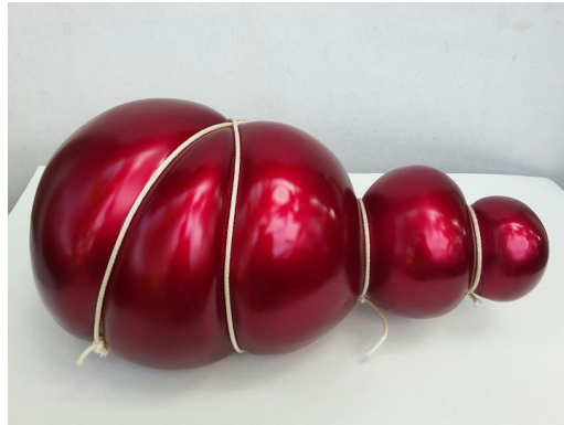
Gambar 1.2 I Wayan Upadana "Connected in the Deep #1" (2017) 20 cm x 45 cm x 25 cm Resin, fiberglass, cat mobil, tali sintetis