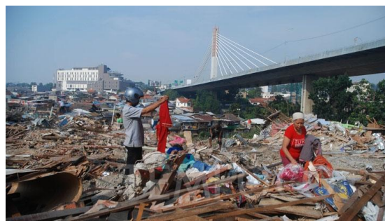
Gambar 1.2 Reruntuhan Tamansari sebagai contoh penggambaran interaksi di ruang sosial