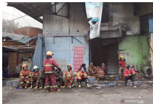
Gambar 1.1 Pasar Kosambi paska kebakaran sebagai contoh penggambaran interaksi di ruang sosial