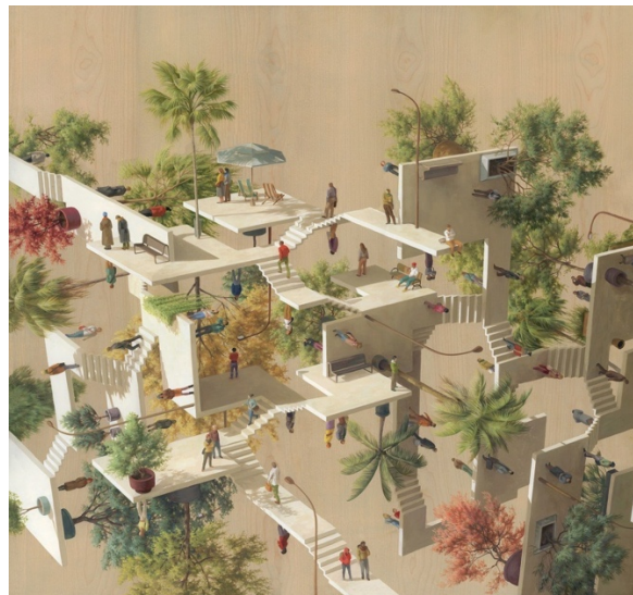
Gambar 1.3 Karya Cinta Vidal “White Park” (2018)

Menurut Henri Levebfre, ruang sosial dibentuk oleh tindakan sosial ( social action ), baik secara individual maupun secara kolektif. Tindakan sosiallah yang memberi “makna” pada bagaimana suatu ruang spasial dikonsepsikan oleh mereka yang mengisi dan menghidupkan ruang tersebut. Produksi ruang sosial berkenaan dengan bagaimana praktik spasial diwujudkan melalui persepsi atas lingkungan ( environment ) yang dibangun melalui jaringan ( networks ) yang mengaitkan aktivitas-aktivitas sosial seperti pekerjaan, kehidupan pribadi ( private life ), dan waktu luang ( leisure ).