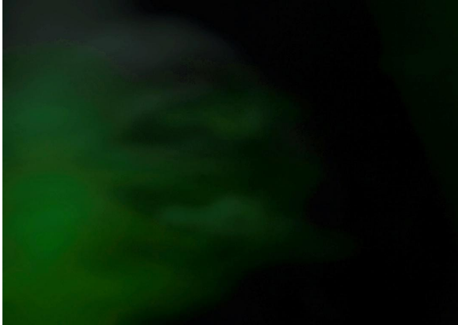
Gambar 3.3 Gambar 3