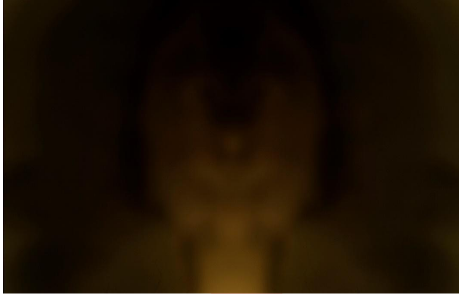
Gambar 3.5 Gambar 5