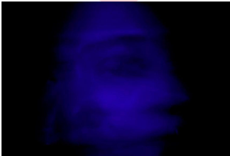
Gambar 3.2 Gambar 2