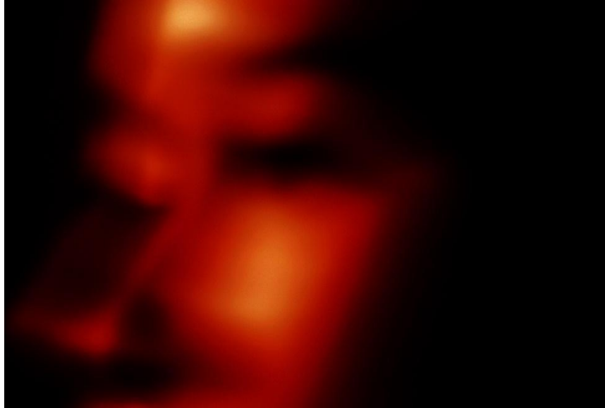
Gambar 3.1 Gambar 1