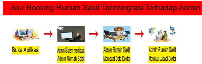
Gambar 2. Alur Booking Rumah Sakit atau Klinik terhadap Admin