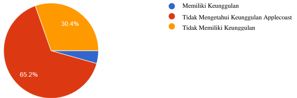
Gambar I. 3 Hasil Kuesioner Persepsi Keunggulan Applecoast Dengan Produk Pesaing

bertujuan untuk mengetahui persepsi konsumen dan keunggulan produk Applecoast dengan distro lain sebagaimana ditunjukkan pada Gambar I.3.