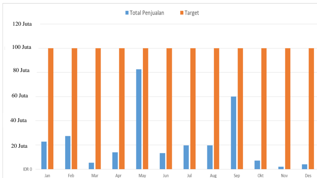
Gambar I. 1 Data penjualan Applecoast Jan - Des 2019

Pada beberapa tahun terakhir fashion menjadi sebuah hal yang penting bagi masyarakat di Kota Bandung. Fashion menjadi sebuah kebutuhan utama bagi sebagian masyarakat di Kota Bandung, tingginya minat dan berkembangnya variasi produk fashion memicu berkembangnya toko-toko distro di Kota Bandung, beberapa toko fashion yang berkembang di Kota Bandung adalah, Cosmic, Unkl347, Badger, Screamous, Uh!, Maternal, Arena XPRNC, Applecoast. Applecoast adalah clothing line /distro yang berada di Jl. Cikutra No. 205, Kota Bandung, telah berdiri sejak tahun 2013. Setelah enam tahun berdiri Applecoast telah melebarkan bisnisnya dengan menjual produk secara offline , online dan bergabung bersama marketplace seperti Tokopedia dan Shopee. Berdasarkan wawancara dengan pemilik Applecoast, perusahaan memberikan data hasil penjualan Applecoast melalui layanan offline dan online periode Januari - Desember 2019, yang dapat dilihat pada Gambar I.1.