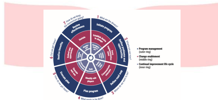
Gambar II- 1 COBIT 2019 Implementation

COBIT 2019 Implementation merupakan salah satu produk dari COBIT yang bertujuan memberikan praktik yang baik untuk menerapkan dan mengoptimalkan informasi dan teknologi sistem tata kelola berdasarkan dengan pendekatan life cycle yang harus disesuaikan, sehingga menjadi sesuai dengan kebutuhan spesifik perusahaan. [6].