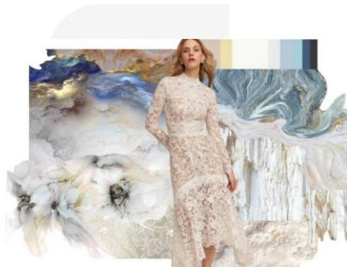
Gambar 4. Imageboard

Tema yang diangkat yakni keindahan kawah ijen karena berdasarkan warna, bentuk, siluet atau garis dan tesktur material yang diperoleh terdapat kombinasi yang selaras untuk tema produk ready-to-wear deluxe . Produk dapat dikategorikan ready-to-wear deluxe dikarenakan produk hanya diproduksi dalam jumlah yang sedikit lebih banyak dari kategori couture , namun bukan juga diproduksi secara masal. Berikut merupakan imageboard perancangan produk