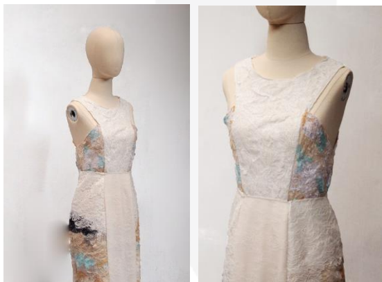
Gambar 7. Produk KAVANA