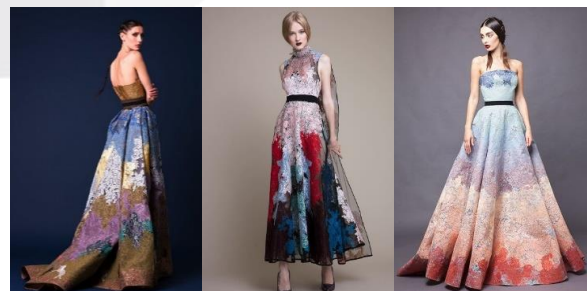
Gambar 2. Rancangan Hussein Bazaza

Hussein Bazaza merupakan fashion designer yang berasal dari Lebanon dan terkenal di Dubai. Dia mendirikan brand dengan label nama dia sendiri yakni Hussein Bazaza pada tahun 2014. Ciri khas rancangannya terletak pada pengolahan material dengan teknik tertentu yang mengacu pada konsep. Dari segi rancangan Ia mengaku memiliki cara dan ketertarikan khusus dalam menggabungkan look haute couture dan ready to wear . Inspirasi utama dalam perancangannya berasal dari apa yang dia rasakan namun tidak banyak orang ketahui [8].