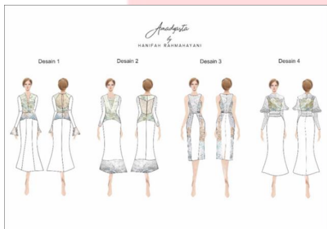
Gambar 6. Sketsa Desain Produk

Eksplorasi lanjutan merupakan eksplorasi yang dilakukan dengan mengacu pada desain busana yang kemudian beberapa eksplorasi unggulan diaplikasikan pada desain busana. Prosentase penggunaan hasil eksplorasi pada busana minimal adalah 50%, sedangkan 50% lainnya menggunakan limbah kain endapan yang juga telah didapat dari rumah mode bridal.