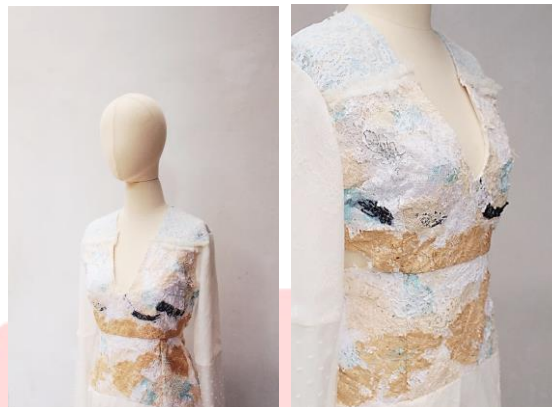
Gambar 8. Produk RANADA