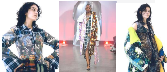
Gambar 3. Rancangan Koleksi Rave Review AW 2020

Rave Review merupakan brand sustainable dan eco friendly fashion yang berbasis di Stockholm. Desainer bernama Josephine Bergqvist dan Livia Schuck merintis dan melahirkan brand ini pada tahun 2017 kemudian mereka mulai debut pada 2018 di Paris Fashion Week [3]. Dengan kampanye sustainable yang dibawa, para desainer tersebut memang menerapkan metode upcycle material yang sebelumnya sudah ada dalam perancangan produknya. Material yang mereka gunakan antara lain bersumber dari pakaian yang mereka temukan di pasar vintage , toko material atau baju bekas, dan perorangan yang menjual material bekas secara langsung maupun online [9].