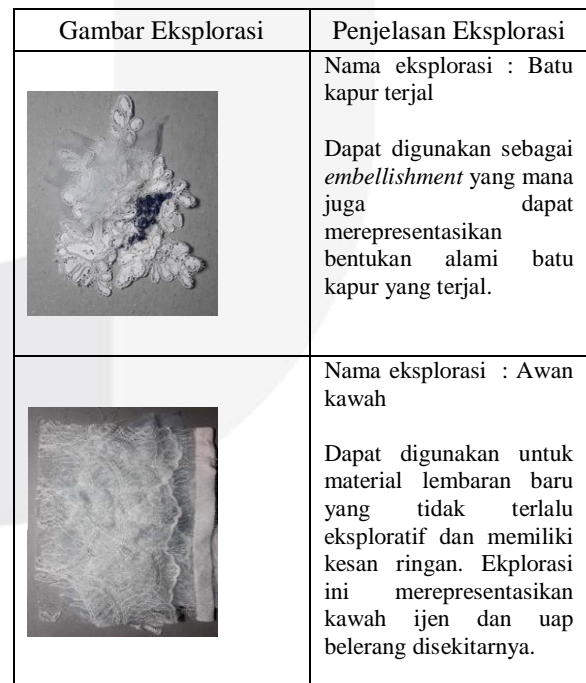
Tabel 1 Data Eksplorasi Yang Berpotensi Untuk Eksplorasi Lanjutan

Berdasarkan data eksplorasi awal selanjutnya dipilih beberapa eksplorasi yang dianggap unggul dan berpotensi untuk dikembangkan menjadi eksplorasi lanjutan.