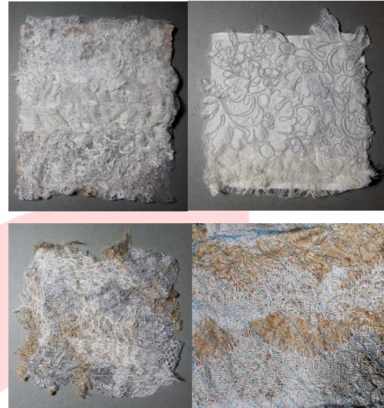
Gambar 1. Eksplorasi Awal

Hal yang dilakukan selanjutnya adalah eksplorasi guna mengungkap karakter-karakter limbah tekstil. Hal ini dilakukan dengan teknik surface textile design seperti layering , stitching , embroidery dan semi-embroidery Data eksplorasi awal Eksplorasi awal merupakan eksplorasi yang dilakukan setelah terkumpulnya limbah yang didapat yang selanjutnya melalui proses sortir material.