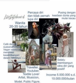
Gambar 5. Lifestyle Board