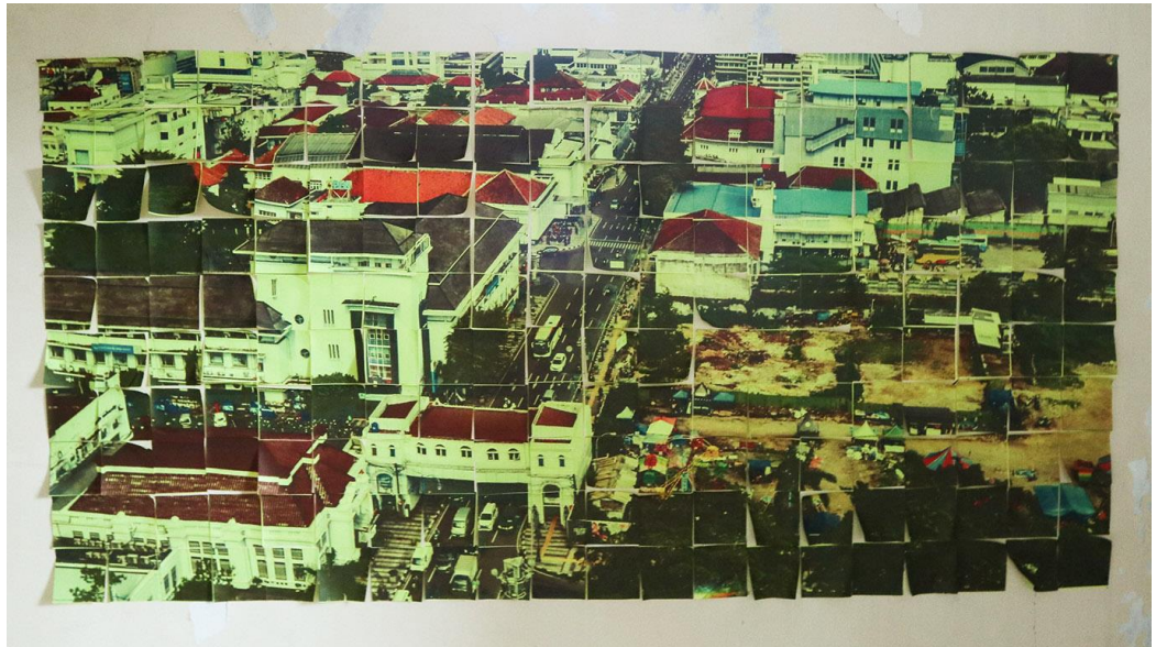
Gambar 3.4.3. Karya ke -3 Lokasi di Mushola