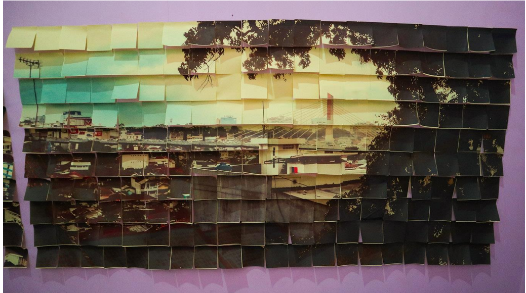
Gambar 3.4.1. Karya ke -1 Lokasi di Ruang Tamu

meungkinkan untuk menerbangkan kertas sedikit demi sedikit. Pada tanggal 17 juni, satu hari setelah karya dipajang atau didisplay penulis berhasil untuk menunjukkan karya telah memenuhi konsep, dengan hasil ada beberapa kertas yang berjatuhan di lantai, berikut foto – foto karya penulis.