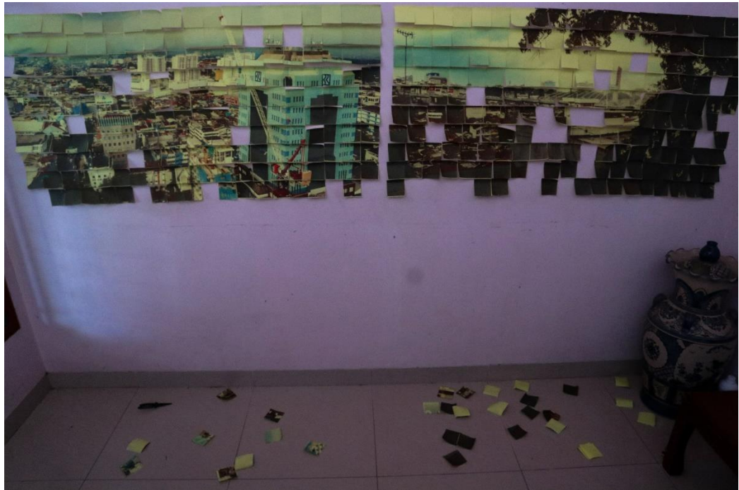
Gambar 3.4.5. Foto karya setelah satu hari