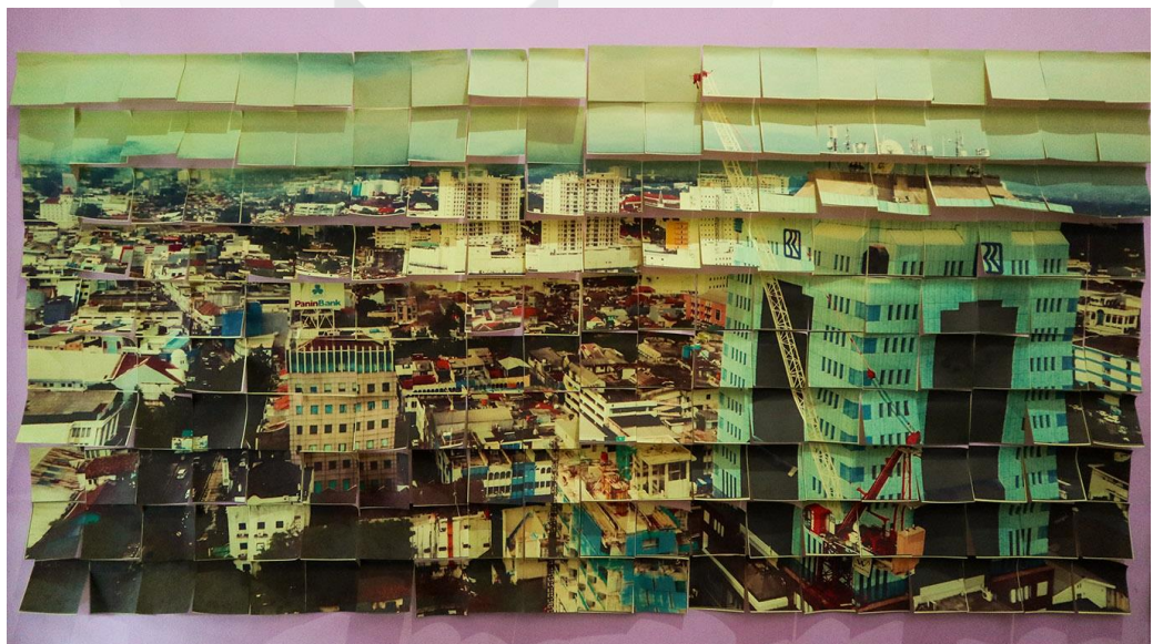
Gambar 3.4.2. Karya ke -2 Lokasi di Ruang Tamu