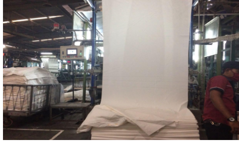
Gambar 1.5 Gambar Proses Dyeing