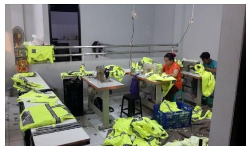
Gambar 1.4 Gambar Proses Penjahitan