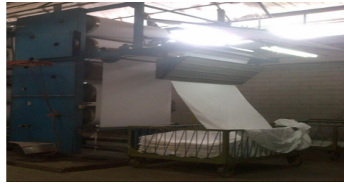
Gambar 1.6 Gambar Proses Dyeing