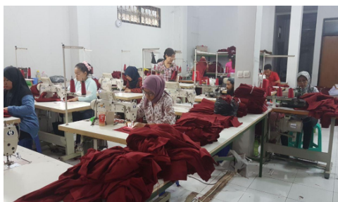
Gambar 1.3 Gambar Proses Penjahitan

Untuk menjamin kemampuan produksi dengan kualitas terbaik, PT Sami Aji Tekstil melengkapi sarana produksi berupa workshop dan kelengkapan produksi yang memadai.