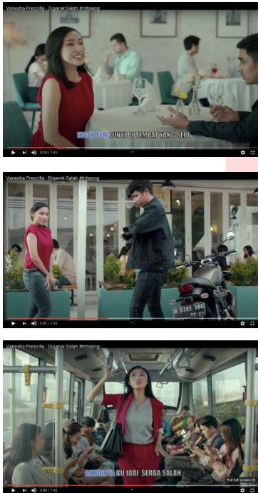
Gambar 1,2 dan 3

Gambar 1,2 dan 3 menjelaskan perempuan yang menggunakan pakaian berwarna merah yang melambangkan sifat dominan, dimana para penonton fokus kepada model utama. Gambar 1 menjelaskan bahwa penggunaan gaun tanpa lengan menegaskan bahwa kejadian tersebut berada pada daerah beriklim tropis. Penggunaan makeup yang natural serta rambut yang digerai memberikan kesan yang elegan. Kejadian tersebut berada pada suatu restoran dengan beberapa pengunjung lainnya. Ekspresi yang dimunculkan adalah ekspresi takut dimana perempuan tersebut ketakutan ketika rasa gatal pada daerah kewanitaannya muncul. Gerakan tubuh