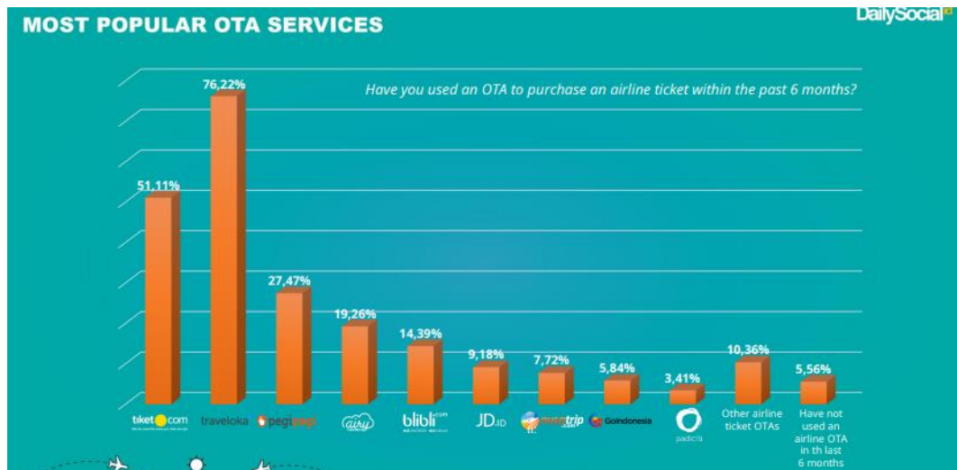
Gambar 1.5 Pengguna OTA Terbanyak (2018)

Pada penelitian ini, peneliti akan menggunakan 3 objek sebagai bahan penelitian sesuai dengan urutan teratas penggunaan terbanyak atau layanan OTA paling terpopuler se Indonesia. Penentuan objek pada penelitian ini merupakan adopsi data yang diambil dari DailySocial.id berdasarkan transaksi penggunaan OTA terbanyak di Indonesia yang dapat dilihat dari gambar grafik berikut.