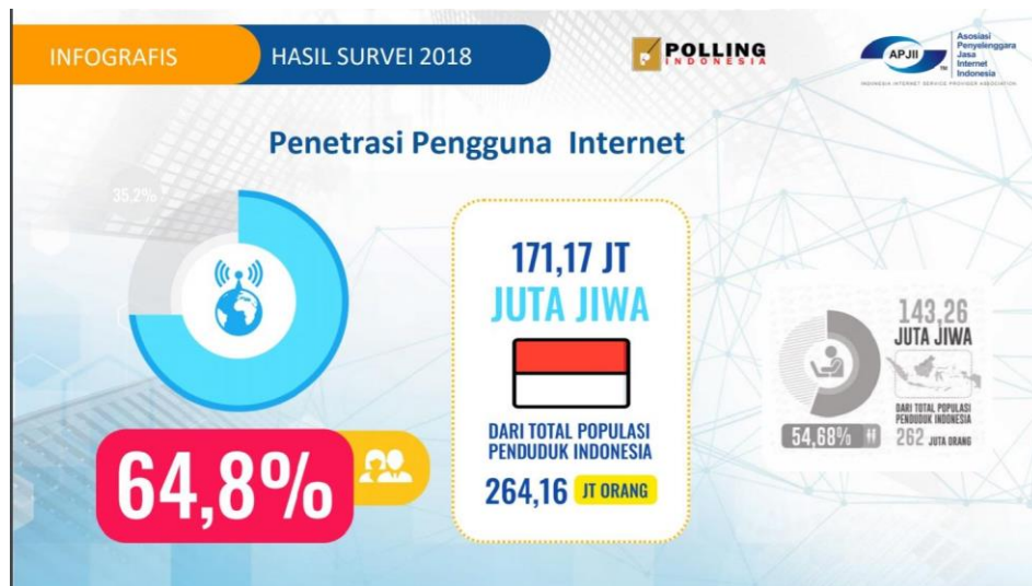
Gambar 1.7 Gambar Penetrasi Pengguna Internet

rentan kurun waktu 9 Maret 2018 sampai dengan 14 April 2018. Yang dapat dilihat pada gambar 1.7