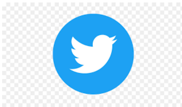
Gambar 1.1 Logo Twitter

Twitter didirikan pada 21 Maret 2006 oleh Jack Dorsey, Noah Glass, Biz Stone, dan Evan Williams. Sosial Media Twitter sendiri dirilis ke publik pada 15 Juli 2006. yang berpusat berada di San Francisco, California, Amerika Serikat.