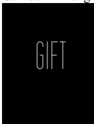
Gambar 2. Tangkapan layar film Love, Dad (2016)

Sutradara : Daniel Yam Tahun Produksi : 2016 Durasi : 7:30 menit Genre : Drama-Keluarga Sinopsis : Seorang anak yang membenci kehidupan yang dijalani oleh ayahnya, menemukan arti pengorbanan sang ayah yang sesungguhnya setelah beliau meninggal dunia.