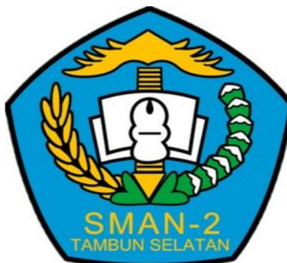
Gambar 1.1 Logo SMA Negeri 2 Tambun Selatan