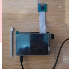
Gambar 3.3 Rencana purwarupa Home Video Conference.

Pada Gambar 3.3 merupakan rencana purwarupa yang akan dirancang oleh penulis. Dimana purwarupa tersebut dapat dihubungkan pada layar monitor/TV melalui socket atau kabel HDMI. Alat tersebut terdiri dari kamera, layar touch-screen, microphone, speaker, dan Raspberry Pi 3 yang diprogram untuk menerima dan memanggil panggilan video conference yang berbasiskan WebRTC menggunakan Jitsi Meet. Sehingga, partisipan hanya cukup mengaktifkan alat tersebut kemudian alat tersebut dapat berfungsi. Dimana masing-masing Raspberry Pi dapat melakukan panggilan. Kami menggunakan Raspberry Pi 3 sebagai perangkat utama dalam Tugas Akhir ini karena menurut kami perangkat ini lebih cocok digunakan daripada perangkat lain seperti Arduino dan lainnya. Selain memiliki memori yang cukup besar, Raspberry Pi 3 juga memiliki berbagai input/output yang cukup lengkap serta dapat dihubungkan dengan perangkat lain yang membutuhkan input/output yang beragam seperti port hdmi , port usb , dan audio jack 3.5 .