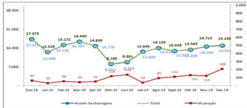
Gambar 1.2 Data Perkembangan Wisatawan Mancanegara yang berkunjung ke Jawa Barat melalui pintu masuk Bandara Husein Sastranegara dan Pelabuhan Muarajati, Desember 2018 – Desember 2019

Muarajati, Desember 2018 – Desember 2019 memiliki jumlah data sebagai berikut :