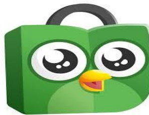
Gambar 1.2 Maskot Tokopedia

Toped sebagai “maskot” dari Tokopedia dan kenapa burung hantu karena burung hantu banyak dijadikan sebagai simbol kecerdasan dan kebijaksanaan, serta burung hantu