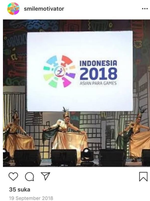
Gambar 1. 3 Penari Disabilitas Smile Motivator di Acara ASIAN PARA GAMES 2018

(Sumber: Instagram.com diakses pada tanggal 28 Februari 2020 pukul 10.02 WIB)