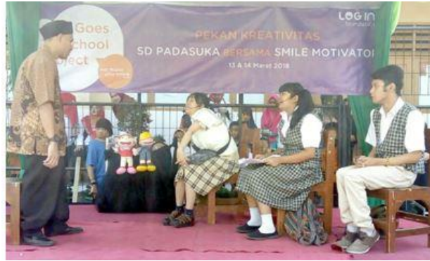
Gambar 1. 1 Capture Berita Smile Motivator Pada Situs beredukasi.com