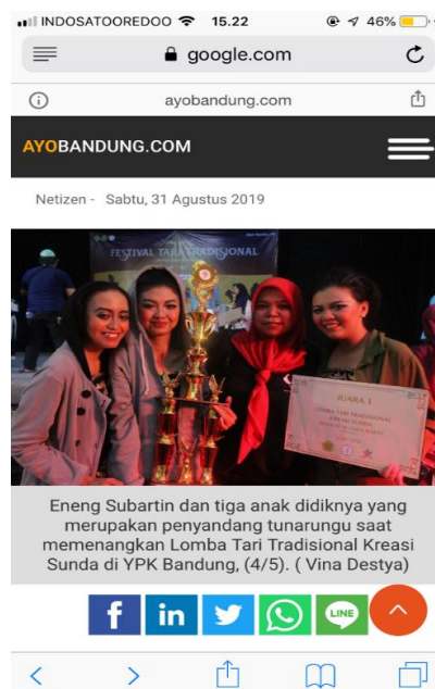
Gambar 1. 5 Capture Berita Smile Motivator Pada Situs ayobandung.com

Dibalik kekurangan yang dimiliki tim penari tunarungu Smile Motivator, mereka ternyata juga mampu bersaing dengan penari-penari normal. Hal ini dapat dilihat saat mereka memenangkan lomba tari tradisional kreasi sunda di YPK Bandung.