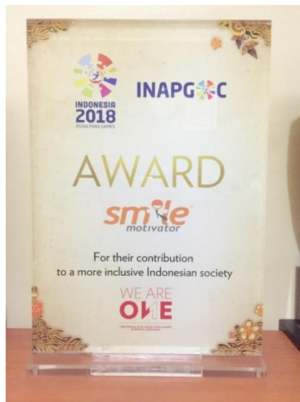
Gambar 1. 2 Penghargaan Atas Partisipasi di Acara ASIAN PARA GAMES 2018