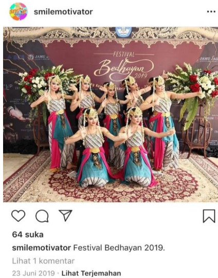
Gambar 1. 4 Penari Disabilitas Smile Motivator di Acara Festival Bedhayan 2019