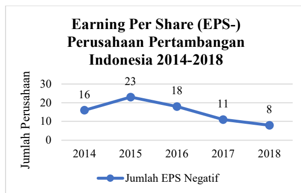
Gambar 1. 1 Earning Per Share (EPS-) Perusahaan Pertambangan Indonesia 2014-2018