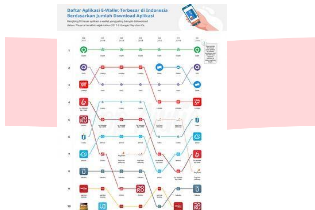
Gambar 1.3 Unduhan Dompot Digital di Indonesia

Menurut laporan riset Kompas Tekno pada 10 aplikasi dompet digital yang menggunakan metode perhitungan dengan variabel jumlah unduhan aplikasi di IOS, App Store, dan Google Play Store. LinkAja menempati posisi ke empat, setelah Go-Pay, Ovo, dan Dana. Secara garis besar aplikasi dompet digital buatan pengembang lokal masih mendominasi metode pembayaran cashless di Tanah Air. Secara berurutan diduduki oleh Go-Pay, Ovo, Dana, LinkAja, i.saku, Jenius, Go Mobile by CIMB, Paytren, Sakuku, dan Doku.