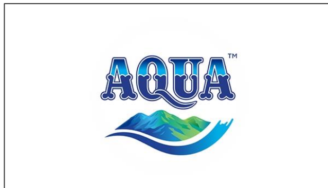
Gambar 1.1 Logo PT Aqua Golden Mississippi Tbk

Perusahaan pada umumnya memiliki logo, untuk memberikan simbol dan memudahkan konsumen dalam mengenali produk. Adapun logo dari perusahaan ini adalah sebagai berikut: