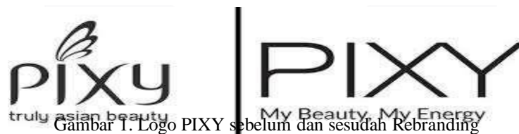
Gambar 1. Logo PIXY sebelum dan sesudah Rebranding

Pada Tahun 2018 PIXY melakukan proses rebranding, dengan melakukan melakukan strategi repositioning melalui perubahan logo, tagline, serta tone & manner yang baru dengan tujuan untuk memperkuat image modern & high quality. Berikut perbandingan tampilan tagline PIXY sebelum dan sesudah rebranding .