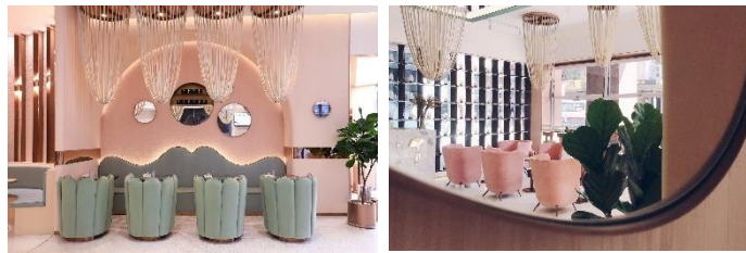
Gambar 1. 5 Ronde TCM Wellness Center, China