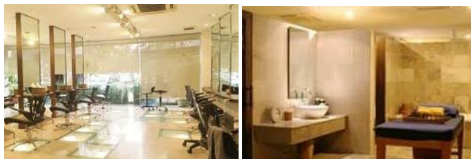
Gambar 1. 3 Roger's Salon, Clinic & SPA