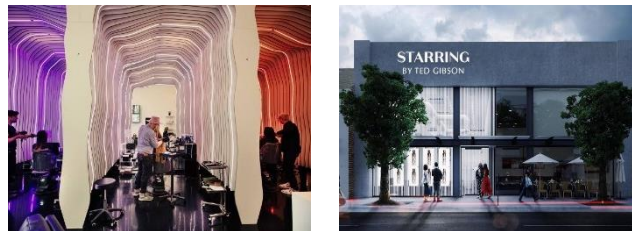
Gambar 1. 6 Srring by Ted Gibson, Lost Angeles