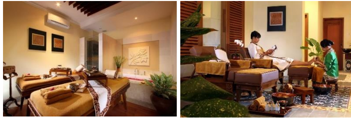
Gambar 1. 4 Martha Tilaar Salon and Day SPA