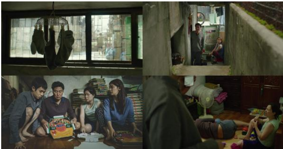
Gambar 1.4 Apartemen Semi-Basement Keluarga Kim

sangat mencolok, dimana keluarga Park tinggal di rumah yang sangat luas, megah dan memiliki fasilitas yang lengkap, sedangkan keluarga Kim tinggal di apartemen semi-basement yang sangat kumuh, sempit dan kotor, bahkan untuk mendapatkan sinyal saja anak-anak dari keluarga Kim harus naik ke atas closet duduk agar bisa mengakses handphone mereka. Di dalam film tersebut juga terdapat scene dimana keluarga Kim harus rela menahan sesaknya asap fogging dari luar hanya agar mereka bisa mendapatkan fogging gratis dengan membuka jendela apartemen mereka yang kecil. Tidak hanya itu, mereka juga harus bertahan hidup saat musim dingin tiba, dikarenakan mereka tidak mampu membeli atau menggunakan mesin penghangat ruangan.