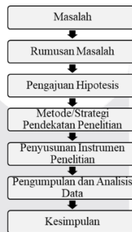
Gambar 3.1 Tahapan Penelitian

Sugiyono (2011) menyatakan bahwa tahapan penelitian terdiri dari rumusan masalah, landasan teori, perumusan hipotesis, pengumpulan data, analisis data, dan kesimpulan dan saran.[12] Pada pengumpulan data, terdapat tahap menentukan populasi dan sampel dan pengembangan instrumen yang dilanjutkan dengan pengujian instrumen.