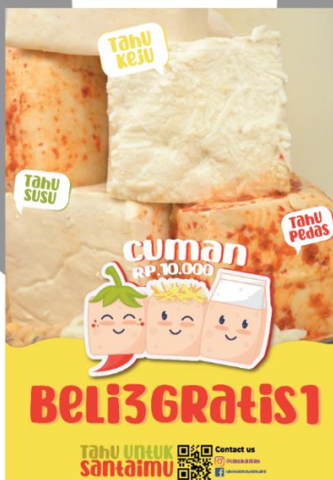
Gambar 2 Perancangan Key Visual

Warna yang dipilih terinspirasi dari warna bahan yang digunakan THL yaitu cabai, keju dan susu. Kemudian warna-warna tersebut akan dipakai sebagai landasan penggunaan warna yang dipilih dalam perancangan desain promosi THL. Jenis huruf yang digunakan adalah Caramel Sweets, termasuk dalam jenis dekoratif yang terkesan ramah dan manis. Pemilihan huruf ini sangat cocok untuk target audiens keluarga dan anak-anak.