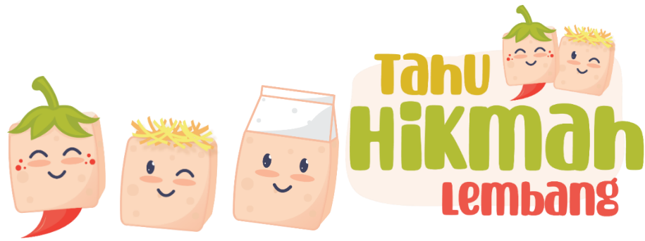
Gambar 3 (a) Maskot dan (b) Logo Perencanaan THL