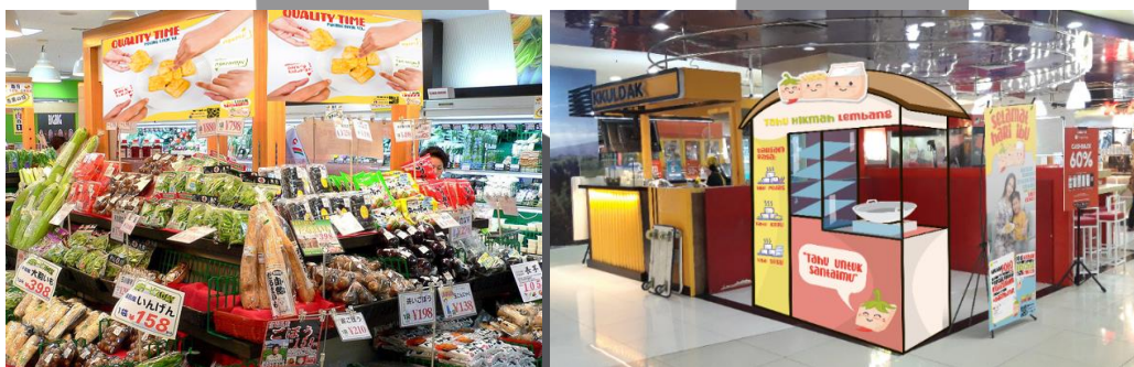
Gambar 4 Penempatan media (a) Poster (b) Booth dan Stand Banner THL

Lalu perancangan promosi THL dibuat dengan metode AISAS, metode ini merupakan penyesuaian media yang akan digunakan dengan target audiens agar mendapatkan informasi tentang produk untuk melakukan pembelian sesuai dengan perencanaan Attention, Interest, Search, Action, dan Share (Nurbani et al., 2019). Dalam tahapan AISAS, attention dilaksanakan terlebih dahulu yang berguna untuk menarik perhatian konsumen terhadap THL berupa poster. Selanjutnya menonjolkan interest dari produk THL yang bisa memikat target audiens juga berupa poster diletakkan pada ambience media di mall. Ditambah dengan sosial medianya ( search ) untuk informasi mengenai THL lebih lanjut, didalamnya juga berisi tentang booth yang akan dibuat oleh THL untuk menarik perhatian konsumen dengan mengadakan promo ( action ) dan memberikan flyer dan brosur. Dalam acara promo tersebut, konsumen diajak untuk membuat konten sosial media Instagram keseruan makan THL dengan keluarga dan menambahkan hastag disetiap postingan yang diunggah. Unggahan yang paling kreatif akan mendapatkan voucher belanja senilai Rp.300.000,00. Tujuan nya adalah untuk mengajak konsumen melakukan promosi secara tidak langsung dan menghasilkan calon konsumen-konsumen baru dalam jangka panjang.