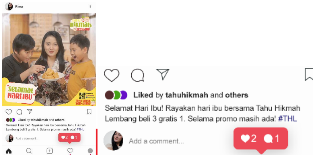
Gambar 5 Perancangan Media Sosial Instagram