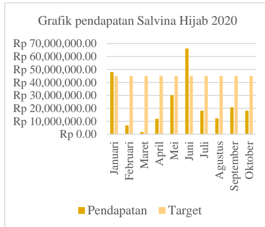
Gambar I. 2 Data pendapatan Salvina Hijab Business-to-customer