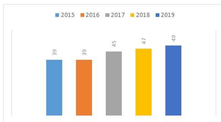
Gambar 1.1 Perusahaan Pertambangan Tahun 2015-2019

Sektor pertambangan merupakan salah satu penopang pembangunan ekonomi suatu Negara, karena perannya sebagai penyedia sumber daya energi yang sangat diperlukan bagi pertumbuhan perekonomian suatu Negara. Potensi yang kaya akan sumber daya alam tersebut akan menumbuhkan terbukanya perusahaan-perusahaan untuk melakukan eksplorasi pertambangan sumber daya tersebut. Perusahaan pertambangan membutuhkan modal yang sangat besar untuk mengeksplorasi sumber daya. Maka dari itu, perusahaan pertambangan menjadi perusahaan publik untuk mendapatkan pendanaan yang digunakan untuk operasional perusahaan, menyerap investasi, dan memperkuat posisi keuangannya. Investasi tersebut digunakan oleh perusahaan sebagai pendanaan eksternal guna mempertahankan kelangsungan hidupnya. Untuk itu dalam melakukan investasi, investor membutuhkan pertimbangan dalam memberikan investasinya tersebut, salah satunya melalui laporan keuangan perusahaan. Perkembangan dalam industri pertambangan begitu pesat di Indonesia. Salah satu perkembangan dari perusahaan pertambangan tersebut dapat terlihat dalam jumlah perusahaan pertambangan dari tahun ke tahun mengalami peningkatan. Berikut jumlah perusahaan pertambangan tahun 2015-2019: