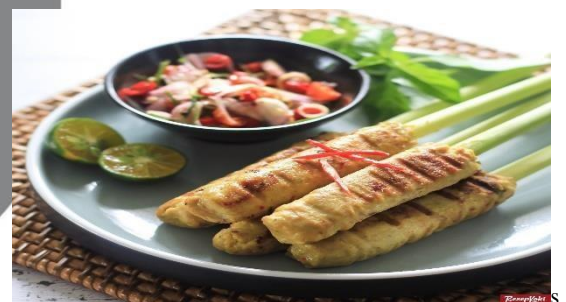
Gambar 4.4.1.1 sate lilit

Sate adalah makanan asli Indonesia, salah satu sate yang terkenal di Indonesia adalah sate lilit Karisna (2013).