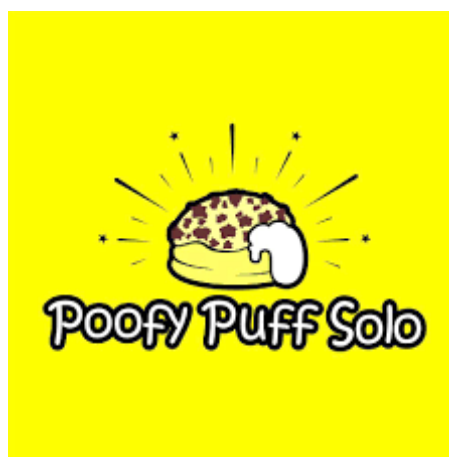
Gambar I. 2 Logo Poofy Puff Solo

Berdasarkan gambar 1.1 dilihat bahwa usaha di bidang makanan memiliki perkembangan yang sangat pesat pada setiap tahunnya, hal ini menyebabkan semakin tingginya persaingan antar pelaku usaha. Pesatnya perkembangan dan persaingan di industri makanan membuat para pebisnis pada bidang ini dituntut untuk melakukan inovasi agar produknya memiliki keunikan tersendiri dan tidak kalah bersaing produk sejenis yang ditawarkan oleh pelaku usaha yang lain. Persaingan yang semakin ketat menuntut pebisnis untuk berlomba-lomba dalam melakukan inovasi dan memberikan penawaran yang terbaik agar dapat memenangkan persaingan pasar. Dengan semakin banyaknya pelaku usaha yang menawarkan produknya yang bervariasi, membuat para konsumen memiliki beragam pilihan yang nantinya akan mereka konsumsi.