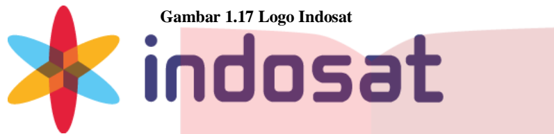
Gambar 1.17 Logo Indosat

Sejak tahun 2005, Indosat telah menggunakan logo yang lebih modern. Logo dengan simbol techno flower ini diharapkan lebih merepresentasikan karakter perusahaan yang mengutamakan kemajuan telekomunikasi untuk seluruh masyarakat Indonesia. Hal tersebut tercermin dalam identitas logo Indosat yang mempersepsikan “teknologi tinggi, namun bersahabat, dinamis dan modern”.