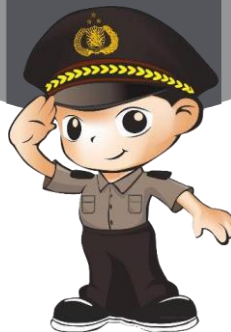
Gambar 2. (Desain karakter dari Divisi Humas Polri )

3.3. Konsep visual ; desain karakter menggunakan maskot yang sudah ada dari Divisi Humas Polri, maskot yang sudah ada belum diimplementasikan dengan baik dan belum maksimal dalam mengenalkan kepada masyarakat. Oleh karena itu, penulis mengeksplor kembali desain karakter yang sudah ada agar menjadi lebih atraktif. Maskot berbentuk polisi laki – laki memiliki karakter yang humanis dan akrab dengan masyarakat serta mudah untuk diingat dan dikenali..