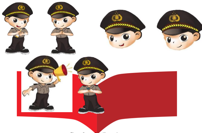
Gambar 3. (Desain karakter yang sudah di eksplor )