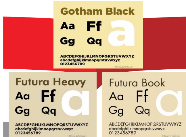
Gambar 5. (tipografi yang dipakai)

3.5. Jenis tipografi ; Jenis tipografi yang akan digunakan yakni Sans Sherif untuk memberikan kesan yang modern dan simple atau sederhana, menyesuaikan dengan tujuan segmentasi Divisi Humas Polri untuk tetap fleksibel di era modern. TypeFont yang digunakan yakni Gotham Black dapat digunakan sebagai header pemilihan font Gotham Black karena tegas namun tidak terlalu kaku dan Futura Heavy , Futura Book sebagai bodytext karena memiliki tingkat keterbacaan yang jelas