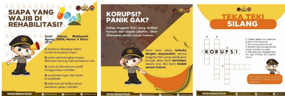
Gambar 6. (Layout konten untuk instagram Divisi Humas Polri )