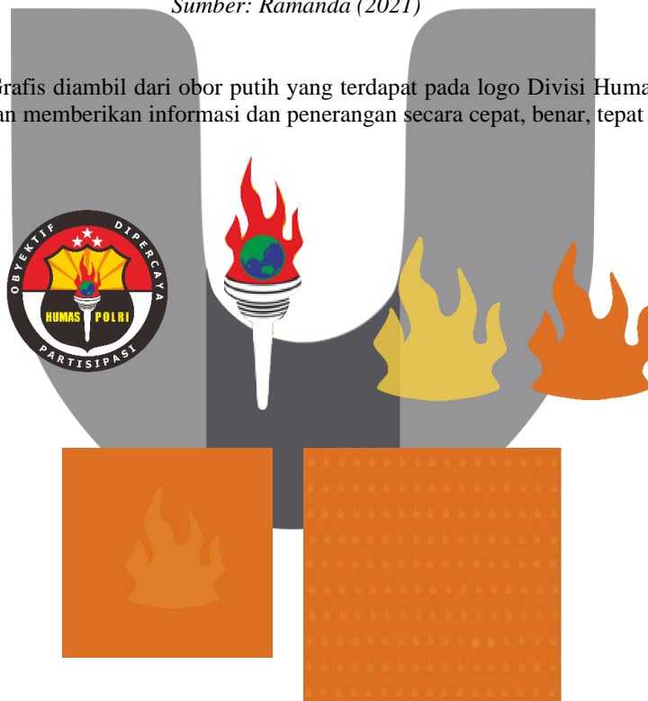
Gambar 4. (grafis layout )

3.4. Grafis layout ; Grafis diambil dari obor putih yang terdapat pada logo Divisi Humas Polri. Arti dari obor dan api melambangkan memberikan informasi dan penerangan secara cepat, benar, tepat dan akurat.