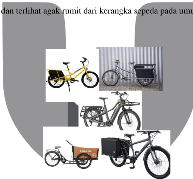
Gambar 2 Image Board

kerangka sepeda cargo yang akan dirancang yaitu kerangka sepeda cargo midtail