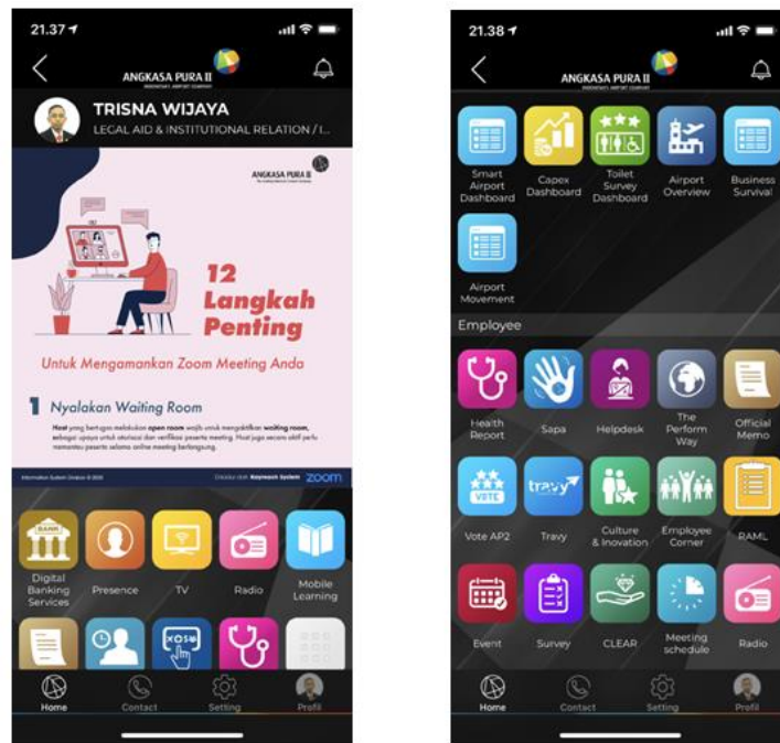
Gambar 1.1 Tampilan Aplikasi iPerform Pada Platform IOS

hal ini membuktikan bahwa tranformasi digital dan Human Capital di PT Angkasa Pura II (Persero) telah sukses dan berada di jalur yang benar.