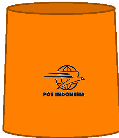
Gambar 1. 2 Karung PT. Pos Indonesia

Setelah melakukan observasi pada proses pembersihan karung, didapatkan data seperti pada tabel 1.1 berikut