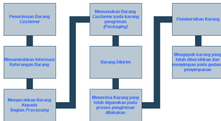
Gambar 1. 1 Alur Proses PT. Pos Indonesia

Pada bagian Processing Center PT. Pos Indonesia dalam pengepakan dan pembersihan karung yang sangat terlihat adalah banyaknya tenaga kerja yang dibutuhkan dalam kegiatan pembersihan karung, dan waktu yang relatif tidak singkat untuk dapat menyelesaikan proses tersebut dan untuk memastikan bahwa barang telah terkirim semua dan tidak ada yang terselip didalam dengan cara membersihkan karung yang sebelumnya digunakan sebagai wadah pengiriman barang. Adanya barang yang terselip dan tertinggal didalam karung berdampak terhadap kualitas pelayanan dan pengaruhnya terhadap loyalitas pelanggan (Hadiyati 2010). Adapun alur proses pada PT. Pos Indonesia adalah seperti yang dicantumkan pada gambar 1.1